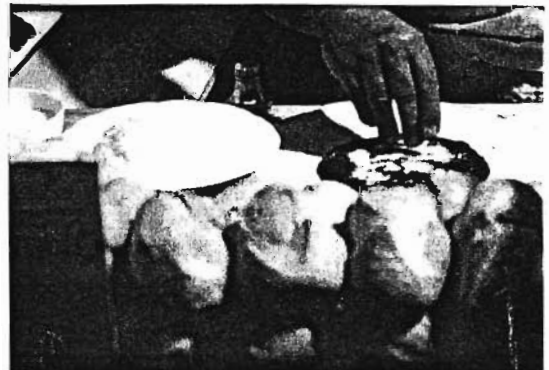
Work Done (1972)