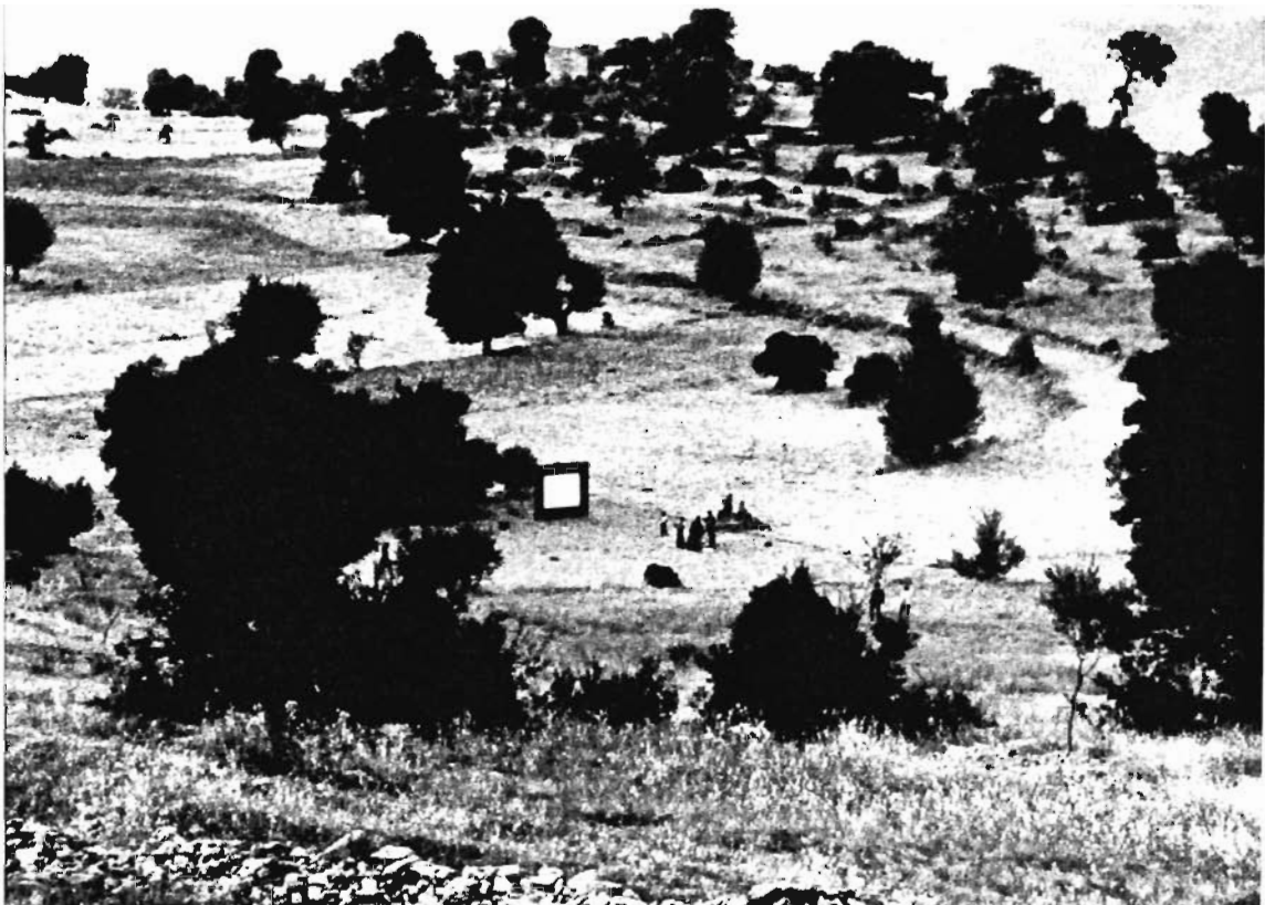
Blick auf Temenos, Ort der Vorführungen vom 25. - 27. Juni 2004